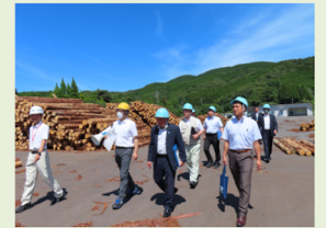
山口県森林組合連合会 西部事業所 視察