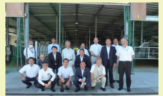
ベルちゃんたちのおうち(株) 視察