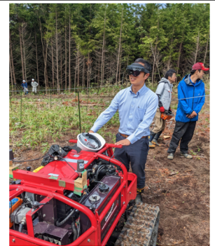
スマート林業研修 (ARグラスを使った下刈り)