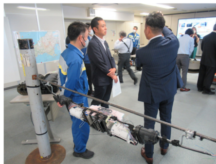
NTT西日本様にて (総務企画委員会市内視察同行)