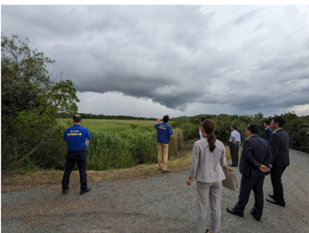
きらら浜自然観察公園にて (環境福祉委員会市内視察同行)