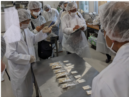
農林業 知と技の拠点 (オープンラボでの商品開発視察)