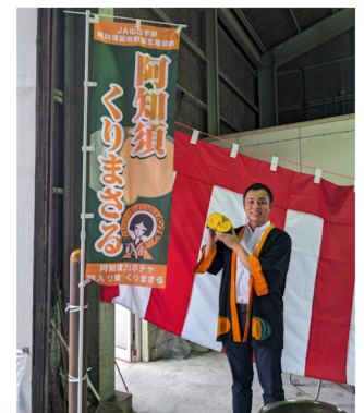
阿知須くりまさる出荷式